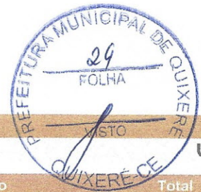
Tabela de Custos - SEINFRA - Versão 024.1