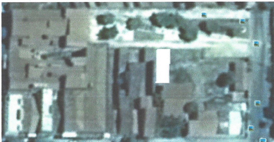
Localização do estacionamento