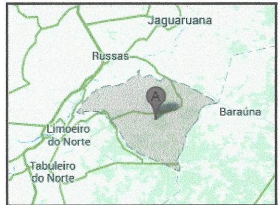
Situação do Município