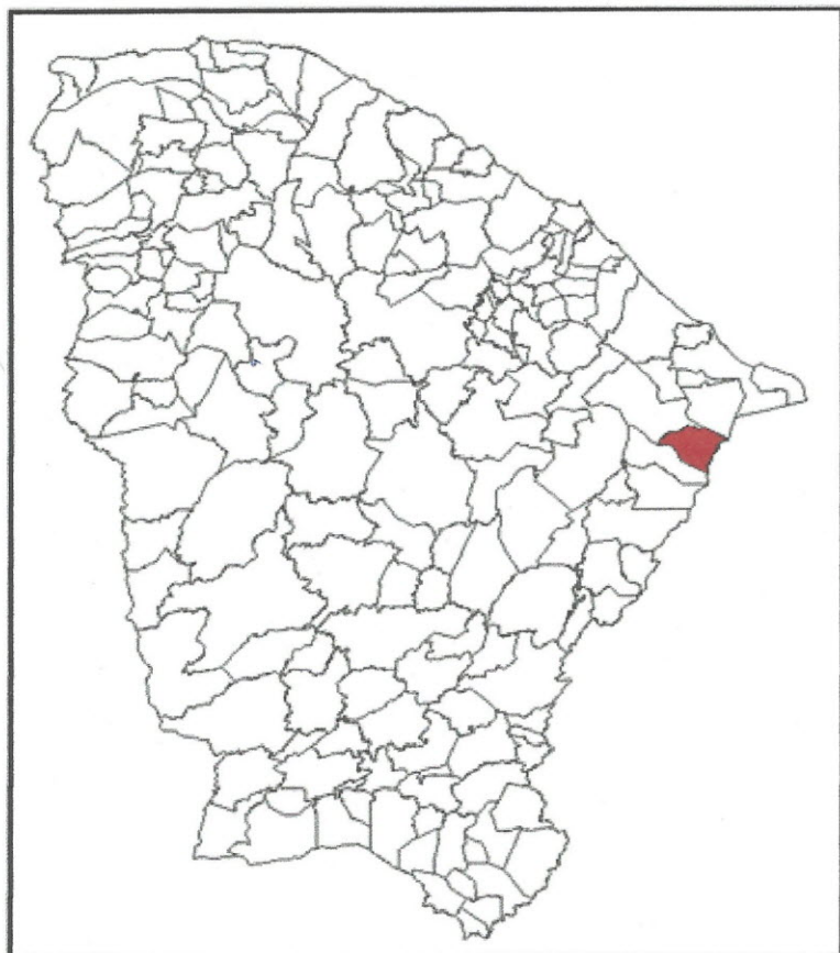
Localização do Município