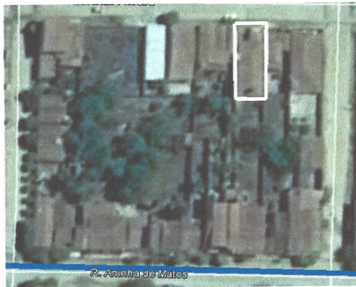
Localização da lavanderia