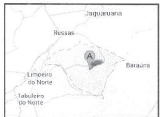
Situação do Município