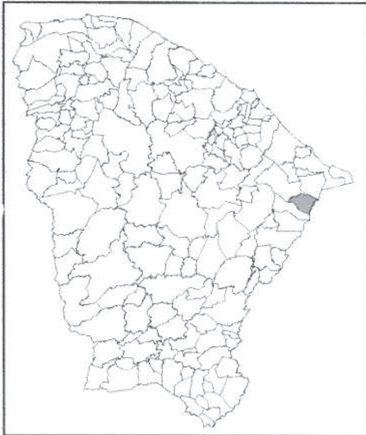
Localização do Município