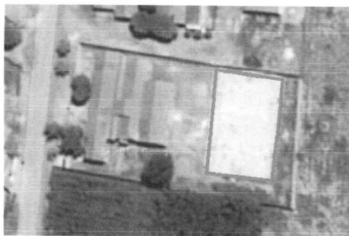
Área de Intervenção