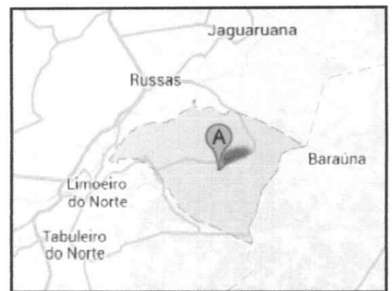
Situação do Município