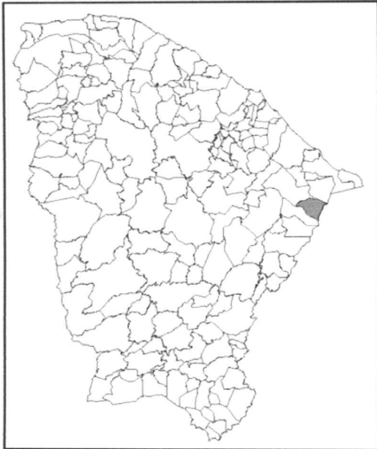
Localização do Município