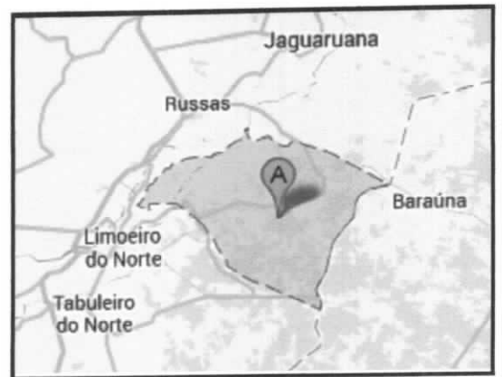
Situação do Município