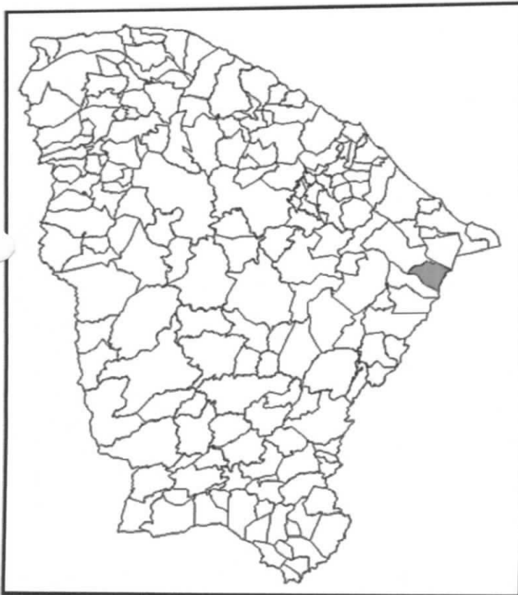
Localização do Município