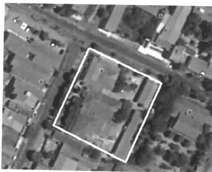
Localização do Hospital Municipal