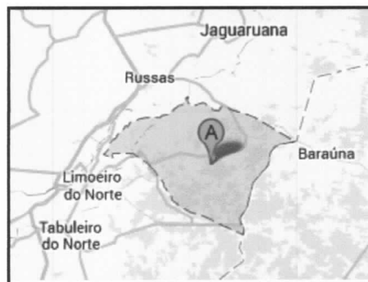
Situação do Município