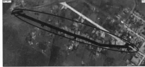
Imagem Satélite