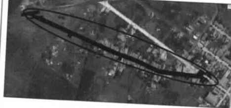
Imagem Satélite