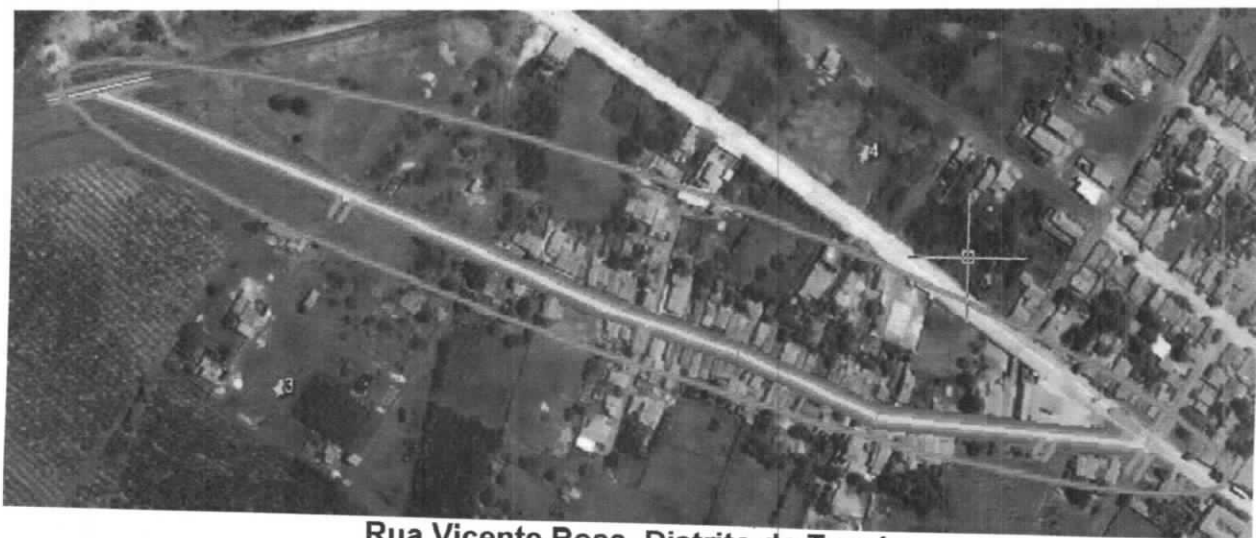
Rua Vicente Rosa, Distrito de Tomé