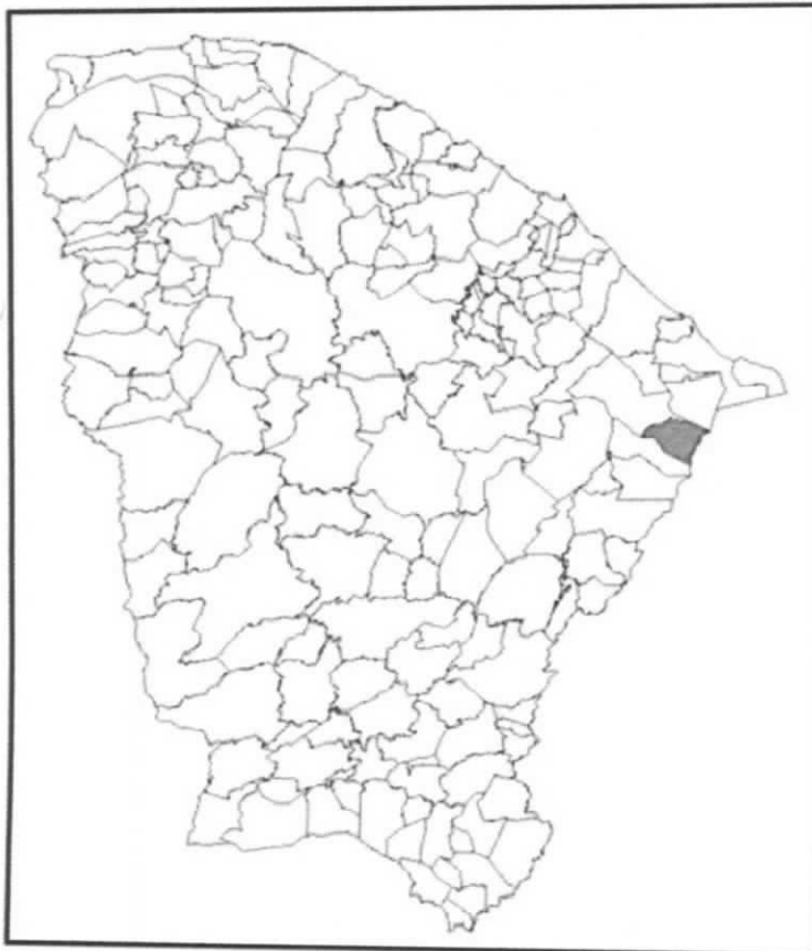
Localização do Município