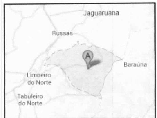
Situação do Município