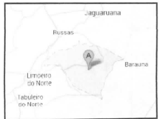
Situação do Município