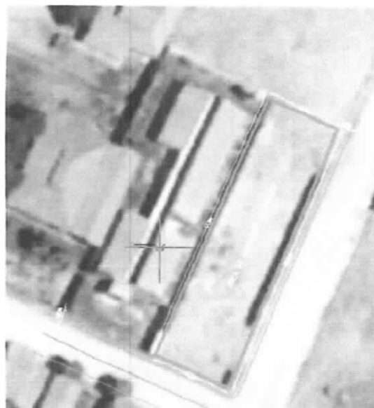
Localização das salas de aula, banheiro e muro