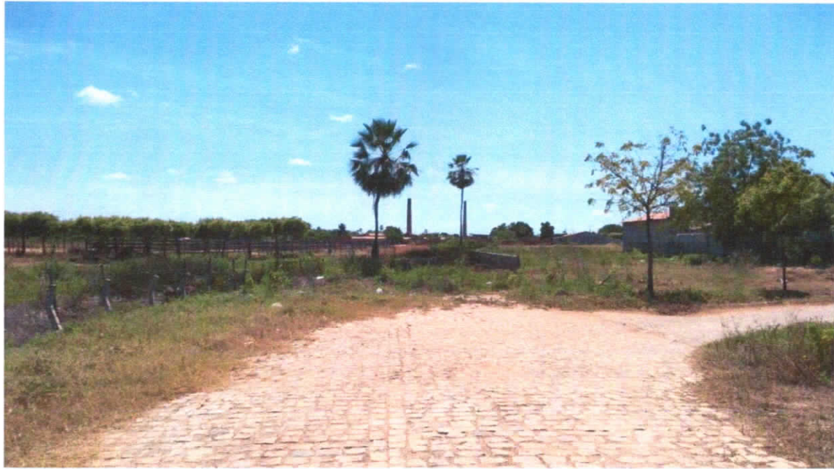
FOTO Nº: 07/07 LOCAL: Rua Mestre Felipe, Centro, Quixeré-CE – TRECHO FINAL

DATA: 24/05/2021 SENTIDO: S - N COORDENADAS GEOGRÁFICAS: 612015.12 m E; 9439705.14 m S