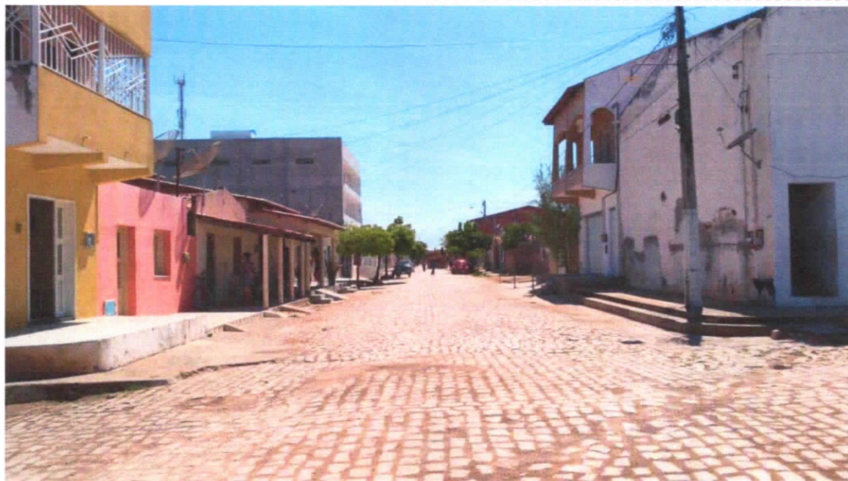
FOTO Nº: 01/07 LOCAL: Rua Mestre Felipe, Centro, Quixeré-CE – TRECHO INICIAL

DATA: 24/05/2021 SENTIDO: S - N COORDENADAS GEOGRÁFICAS: E(X) 611717.78 m E; 9439068.90 m S