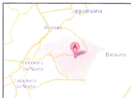
Situação do Município