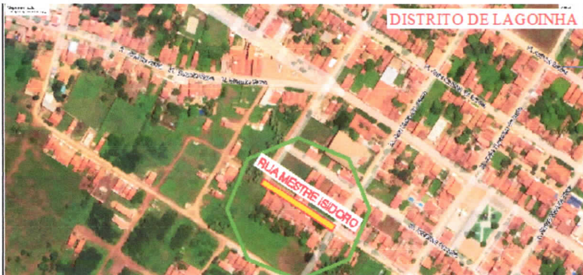
RUA MESTRE IZIDÓRIO