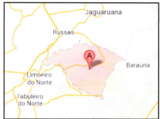
Situação do Município