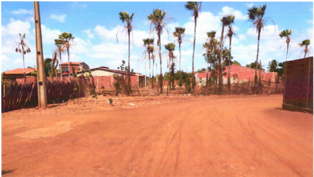
FIM DA RUA MESTRE IZIDÓRIO

E-0m: E(X) 620.668,00m, N(Y) 9.437.949,00 m