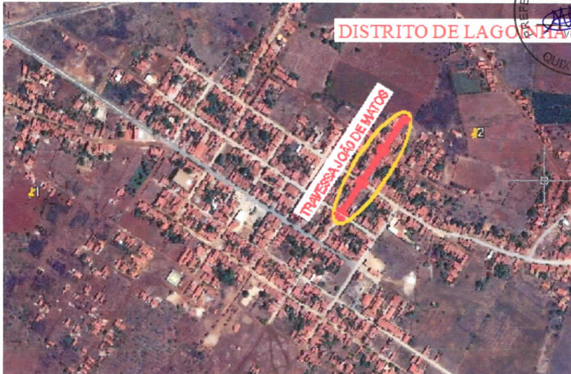
TRAVESSA JOÃO DE MATOS