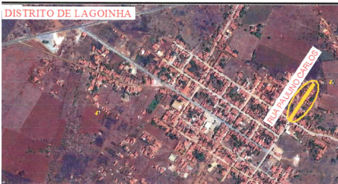
RUA PAULINO CARLOS