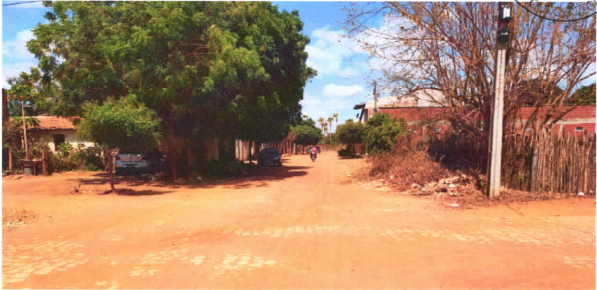
INICIO DA RUA MESTRE IZIDÓRIO

E-0m: E(X) 620.668,00m, N(Y) 9.437.949,00 m