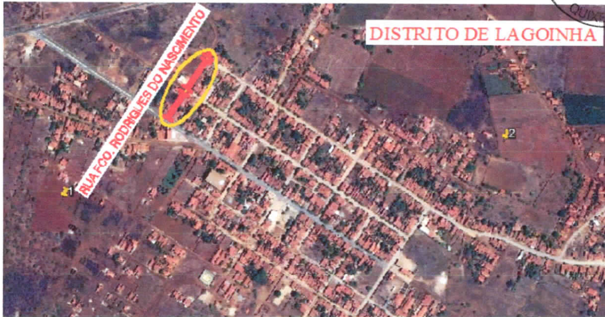
RUA FRANCISCO RODRIGUES DO NASCIMENTO