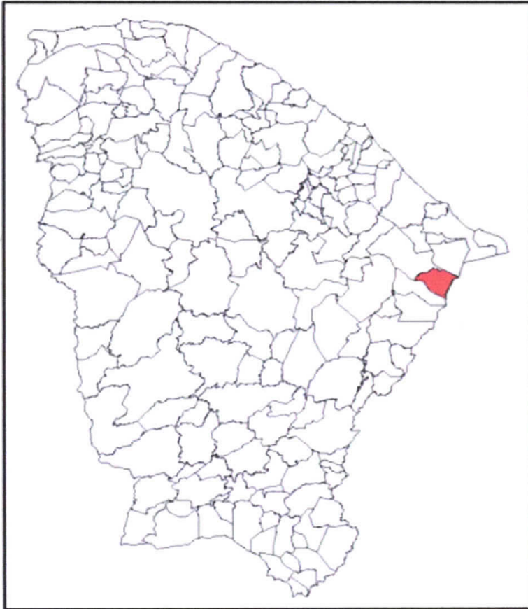
Localização do Município