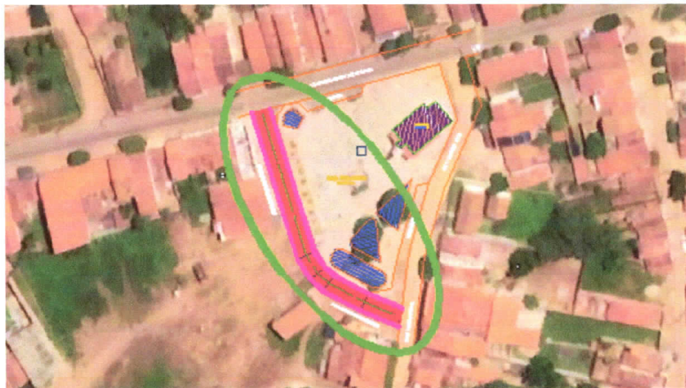
TRECHOS A SEREM PAVIMENTADOS