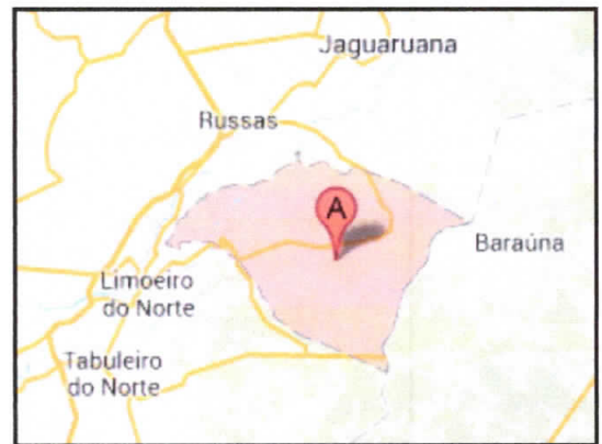
Situação do Município