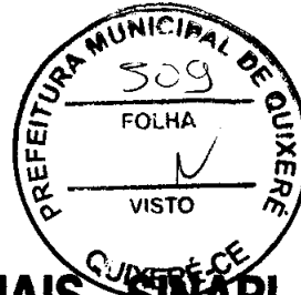
TABELA DE ENCARGOS SOCIAIS - SINAPI