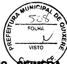
TABELA DE ENCARGOS SOCIAIS - SEINFRA