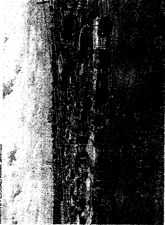
A "TERRA Prometida - Vítimas da Covid-19" foi desocupada em fevereiro de 2025.

A Secretaria das Cidades (SCidades) informou que aguarda a próxima seleção de projetos pela Caixa Econômica Federal, prevista para 2025, para atender o número de 78 famílias na Terra Prometida-Vítimas da Covid-19. Elas esperam a construção do Minha Casa, Minha Vida (MCMV) desde a desocupação, sendo que o terreno está localizado às margens da CE-401 (avenida Carlos Jezeff), em frente ao Aeroporto Internacional de Fortaleza e é ocupado por pessoas em situação de vulnerabilidade.