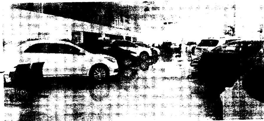
MODELO E AS VERSÕES FORAM ACRESCENTADOS À LISTA

Em negociações, o programa subsidia a compra de 265 versões de 32 modelos de carros, de nove montadoras