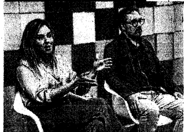
JADE Romero participou ontem do programa O POVO News

Em entrevista ontem ao programa O POVO News, a vice-governadora Jade Romero (MDB) comentou a atuação de torcidas de futebol em apoio aos candidatos à Prefeitura de Fortaleza